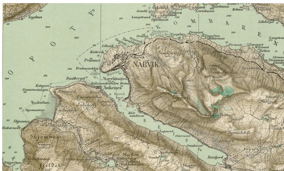
Mapa okolic Narwiku i Ankenes

Bardziej niż prawdę ścisłą działań wojennych pragnęła owa opowieść oddać prawdę najściślejszą procesów myśli, przemian duchowych, nastrojów, jakie narosły w huku armat na dalekiej północy. Wzięła sobie za zadanie wypowiedzenie na teraz i na potem tego, co myślało, czym się trapiło, o co walczyło, nad czym bolało, w czym pokładało nadzieje owo młode pokolenie, które do tej armii poszło poprzez granice, góry i lasy, owi ludzie z Francji, żołnierze. Chciałbym, aby na tych kartach i w tych rozmowach ukazali swe najbardziej ważne myśli. Wtedy bowiem opowieść spełniłaby swoje zadanie.