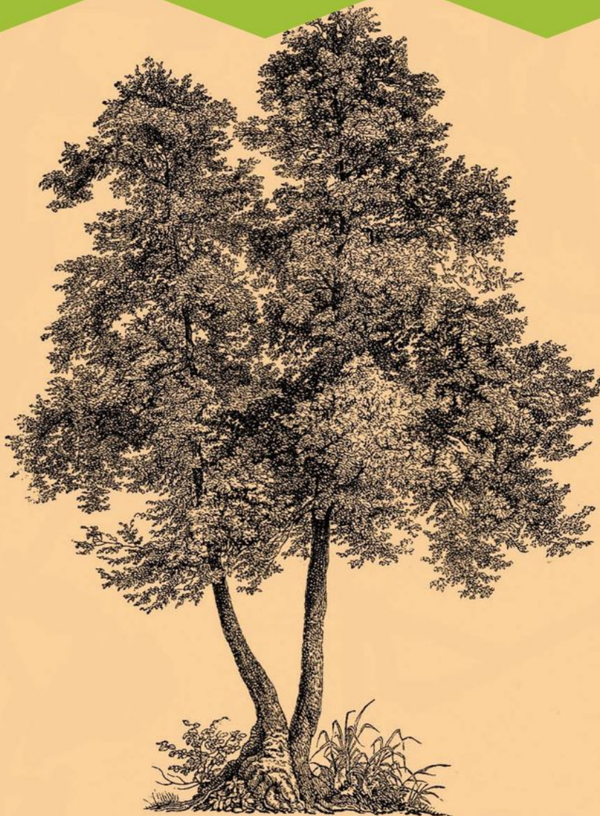
1. Ольха черная ( Alnus glutinosa ).